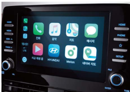
8"-os Display audio rendszer