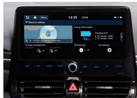
10,25"-os Navigációs rendszer