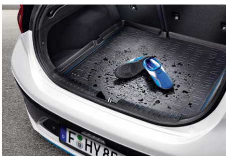
Csomagtértálca - 24 600 Ft