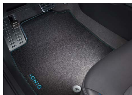
Velúrszőnyeg garnitúra - 25 200 Ft